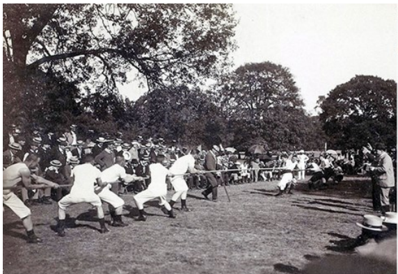
Tir à la corde. La Suède contre le Racing Club de France, photographie anonyme, 1900.

Les Jeux Olympiques de 1900 à Paris étaient assez inhabituels. Ils ont duré plus de cinq mois et ont été intégrés à l'Exposition universelle de Paris de cette année-là. Certaines compétitions se sont déroulées dans des circonstances étranges, comme le tir à la corde en eau profonde où les concurrents ont dû tirer un bateau dans la Seine.