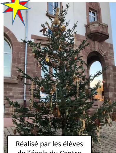
Réalisé par les élèves de l'école du Centre