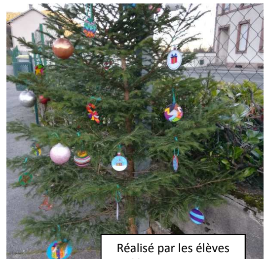
Réalisé par les élèves de l'école de Rougville